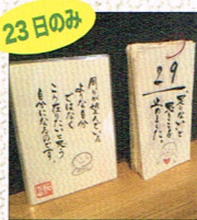
23日のみ カレンダー & ポストカード by 植田加代子