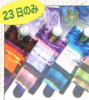
23日のみ オーラソーマ・タロット 数秘鑑定 by ソフィア