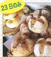
23日のみ 体に優しいぱん by cura pane