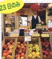
23日のみ りんご販売 by りんご専門店・夢市場