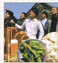
篠山の美味しいもん by 篠山市地域おこし協力隊