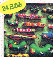
24日のみ 手作り雑貨 by wak* (ワク)