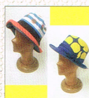
オリジナル手作り帽子 by hatter kaz