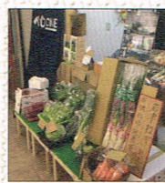
こだわり野菜販売 by ベジ ONE