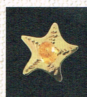
オリジナルアクセサリ by Sae+Sumi Koru