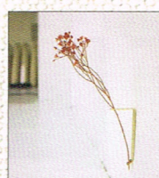
オリジナルデザイン雑貨 by Y