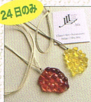
24日のみ ガラスアクセサリ by L L L y.biz