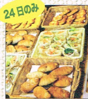
24日のみ 手作りパン販売 by ハルソラ

会場：飛行船スタイルショップ (1F) & ギャラリー (2F) 大阪市西区京町堀 1-12-8 飛行船スタイルビル 1F&2F