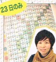
23日のみ マヤ鑑定 (R) by あずまマヤ鑑定士 kinoco