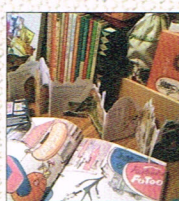
古書絵本+インド雑貨 by kosho-ri