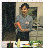
ワイン & ワインのアテ by shoku; taku