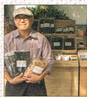
だしリウム工房の昆布屋 by 豊中松前昆布本舗