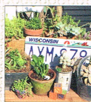
植物 & 手作り雑貨 by 神吉親子