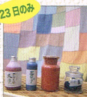
23日のみ ベンガラ染め体験 by 古色の美