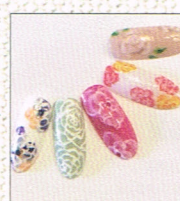
ネイルアート & ケア by あかねいる