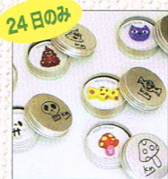
24日のみ 木彫り雑貨 & ワークショップ by ムラバヤシケンジ