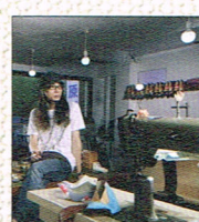
オーダー靴 & 皮小物 by 小林製靴